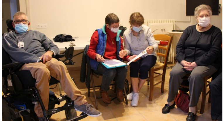
Rencontre annuelle des bénévoles