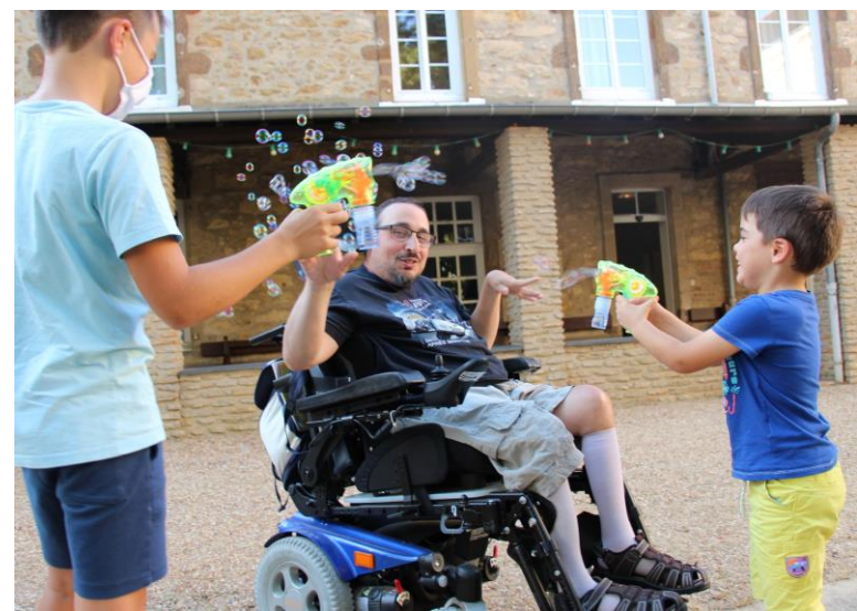
Belle soirée estivale pour la reprise de nos « dîners communs » après quelques mois de suspension sanitaire