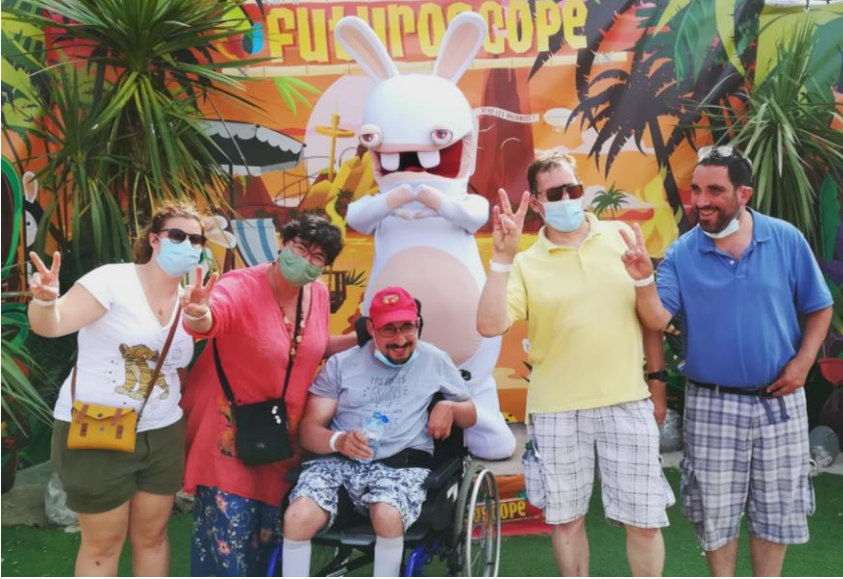
Mini-séjour d'été avec une journée au Futuroscope