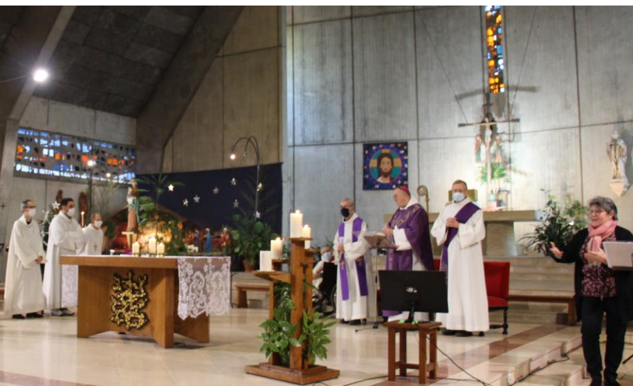
Vie spirituelle : messe télévisée pour France 2 avec la Paroisse Saint Aldric et veillée de la Pastorale des personnes handicapées du diocèse