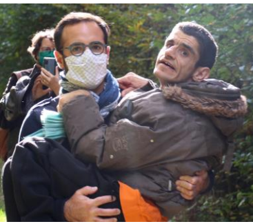
Journée à l'Abbaye de la Trappe