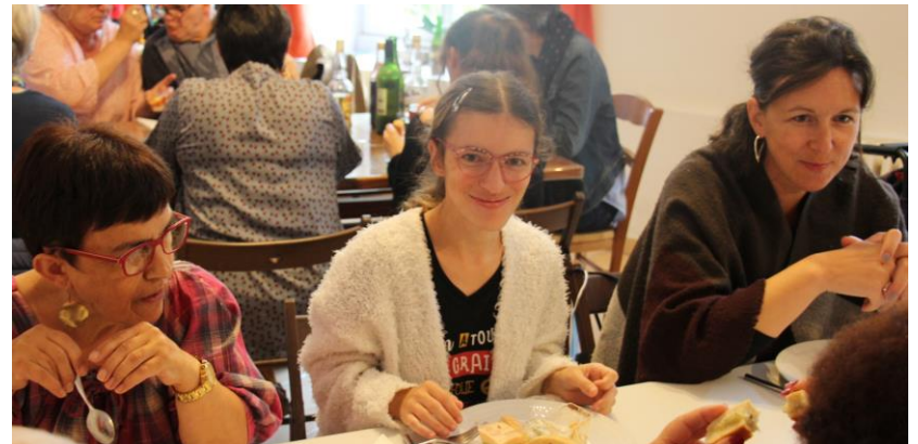
Journée de rentrée : retrouvailles avec les familles et réunion du Conseil de la Vie Sociale