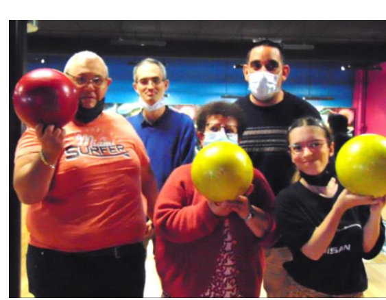
Les bons moments entre amis : repas, bowling, pétanque...