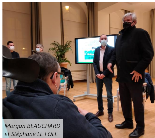
Morgan BEAUCHARD et Stéphane LE FOLL