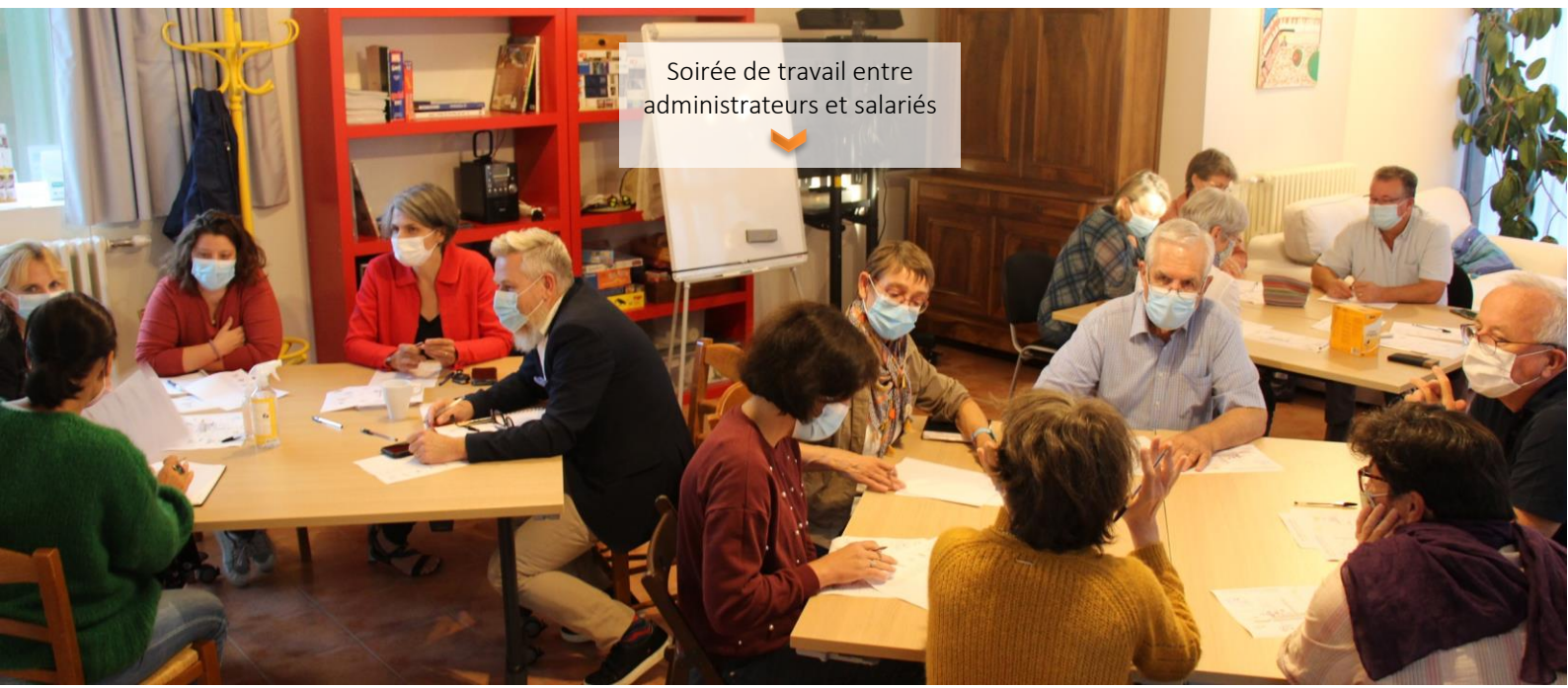
Soirée de travail entre administrateurs et salariés