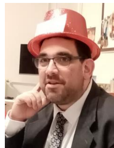
Réveillon de la Saint Sylvestre... « Bonne année et bonne santé ! »