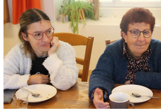
Goûter avec des amis bretons de passage