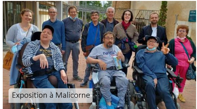
Exposition à Malicorne