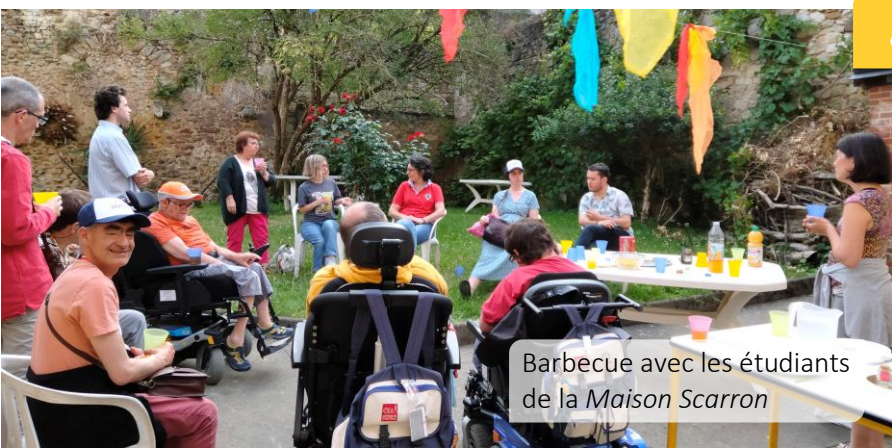
Barbecue avec les étudiants de la Maison Scarron