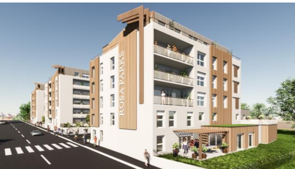
Visuel 3D du projet d'ensemble