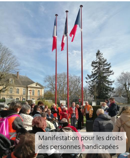
Manifestation pour les droits des personnes handicapées

Retour sur quelques bons moments partagés au sein de la Maison Saint Damien et sur les principaux temps-forts de notre vie associative.