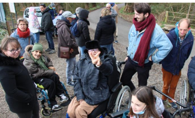
Week-end sous la neige à l'Abbaye de Soligny-la-Trappe