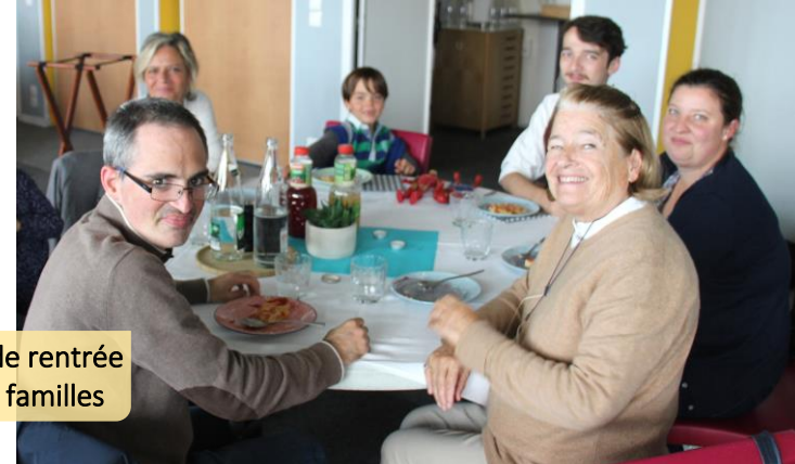
Journée de rentrée avec les familles