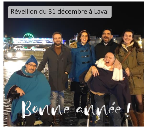
Réveillon du 31 décembre à Laval