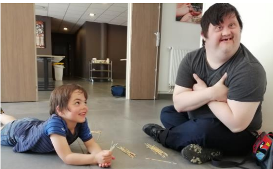
Journée diocésaine des personnes en situation de handicap