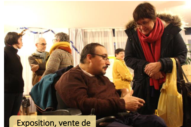
Exposition, vente de fromages et de miel