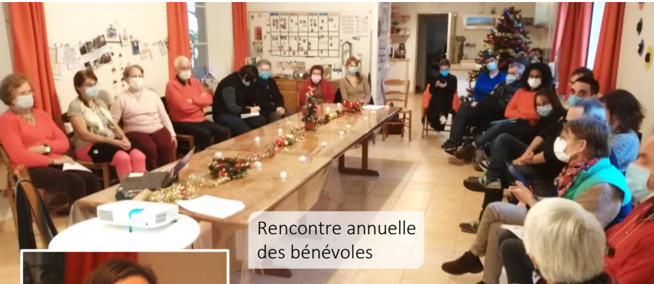
Rencontre annuelle des bénévoles