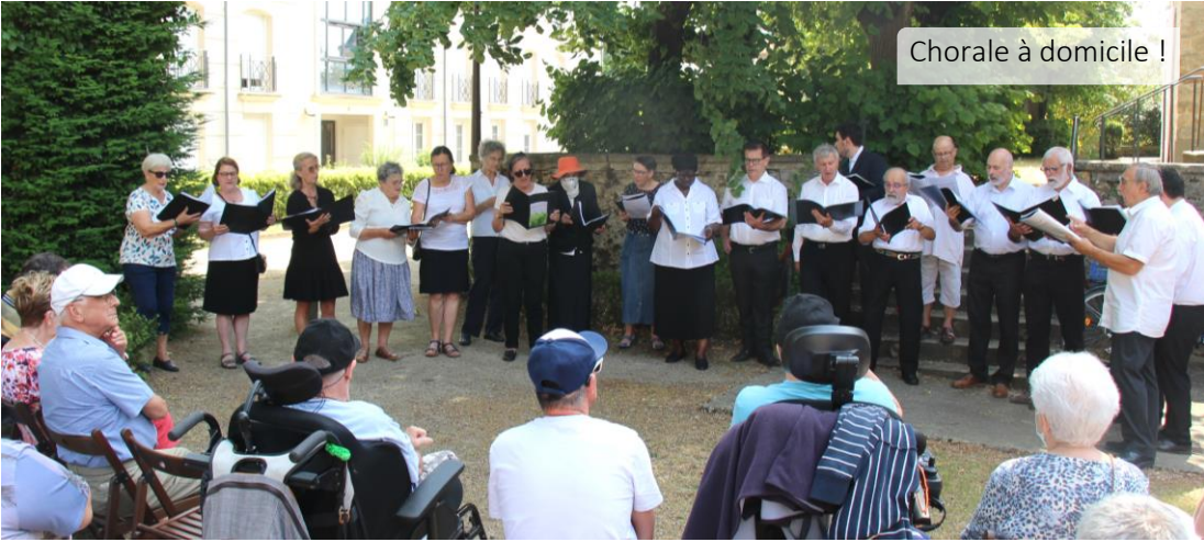
Chorale à domicile !