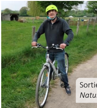
Sortie à L'Arche de la Nature avec les scouts