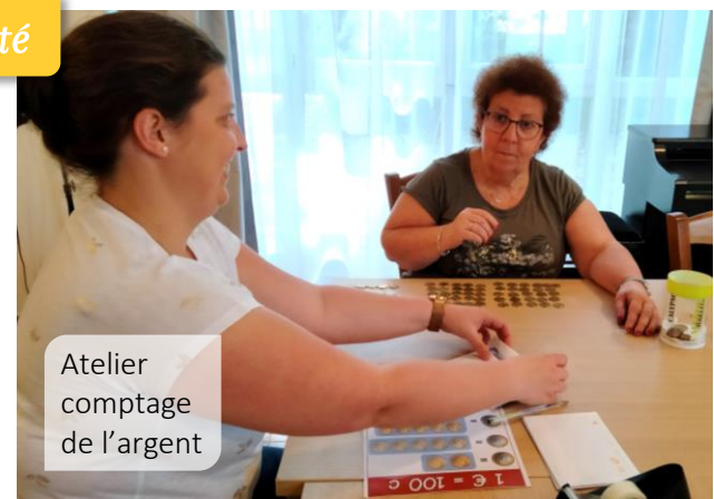
Atelier comptage de l'argent