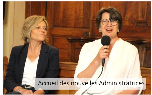
Accueil des nouvelles Administratrices