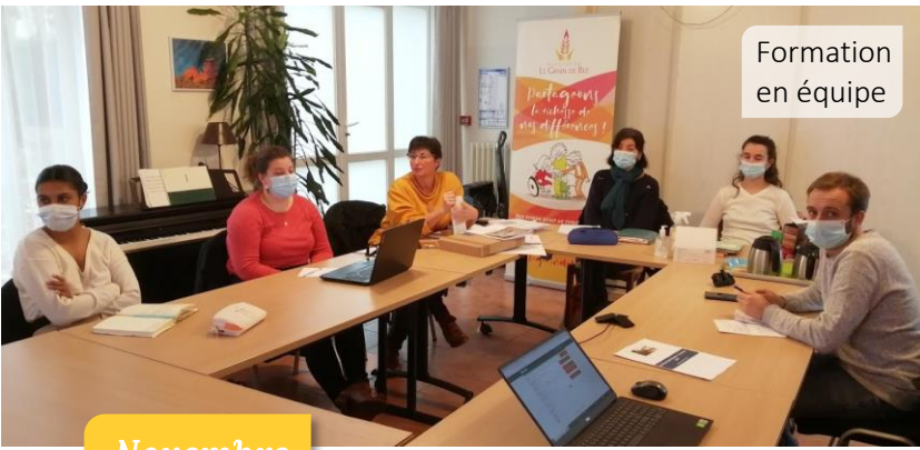
Formation en équipe