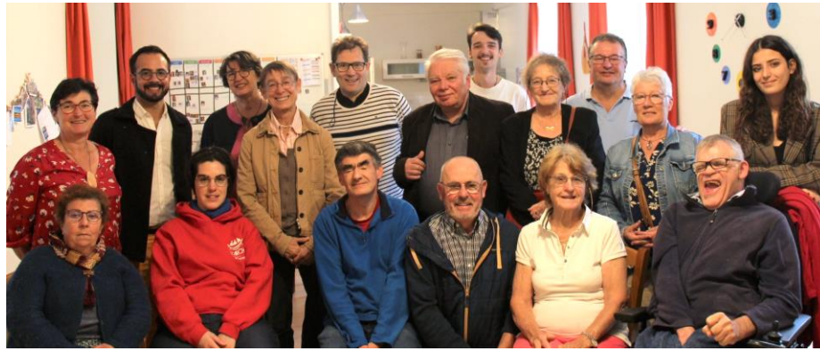
Remises de chèques pour le projet de la Maison Rosa Ci-dessus : Amicale des Anciens de Saint Pavin Ci-dessous : Congrégation de Sainte Croix