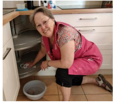
Grand ménage d'été de la Maison Saint Damien avec les salariés, volontaires et amis bénévoles