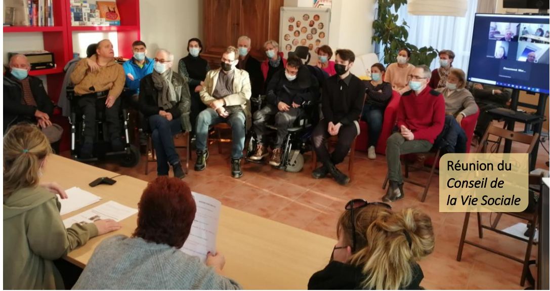
Réunion du Conseil de la Vie Sociale