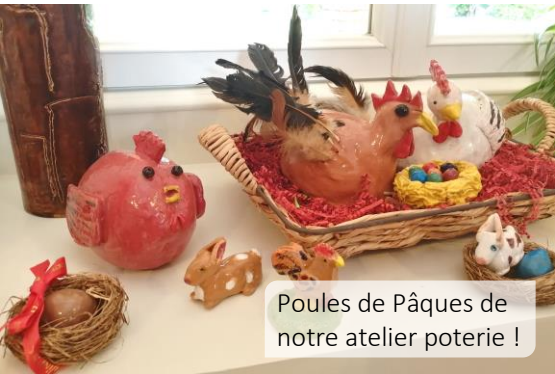
Poules de Pâques de notre atelier poterie !